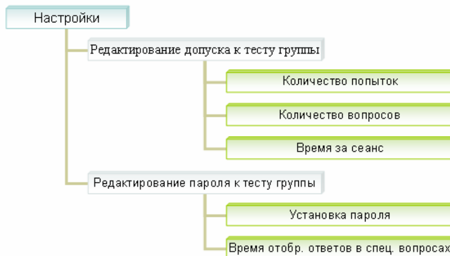
Рисунок 2 – Параметры теста в системе OpenTEST

После установления всех параметров тестирования следует перейти к следующему этапу.