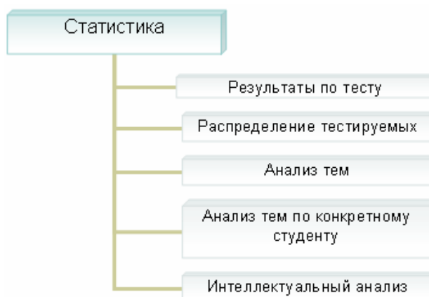
Рисунок 3 – Параметры просмотра и анализа результатов

Просмотр результатов тестирования и оценочные характеристики Вы можете получить, зайдя в раздел «Статистика» с главной страницы системы OpenTEST после ввода данных о группе, фамилии и пароле. Вы можете получить статистическую информацию по результатам теста в следующем виде (рис.3):