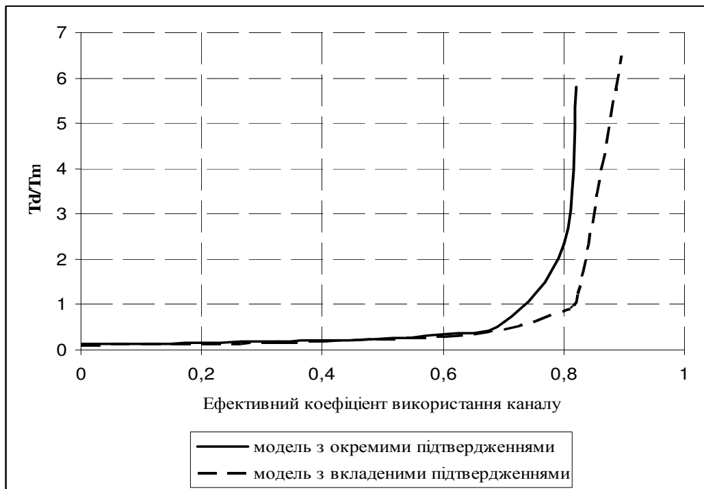
Рисунок 2 - Нормований час відповіді в мережі без встановлення з'єднання ( k=0,1 )

З отриманих графіків видно, що в першому випадку при збільшенні коефіцієнту використання каналу (тобто при збільшенні навантаження на канал) доцільніше використовувати модель з вбудованими повідомленнями. Максимальний коефіцієнт використання каналу в цій системі становить 0,909 проти 0,83 у системі з окремими повідомленнями. Крім того, після перетину значення \rho_M = 0,7 система з вбудованими підтвердженнями має менший час відповіді в порівнянні з системою, орієнтованою на передачу окремих повідомлень. Що безумовно свідчить на користь першої моделі.