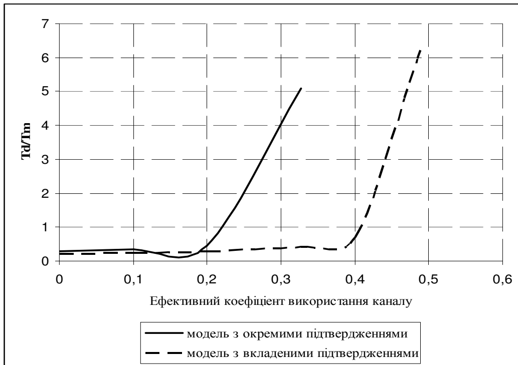
Рисунок 3 - Нормований час відповіді в мережі без встановлення з'єднання ( k=1 )

Другий випадок ( k=1 ) є, так би мовити, критичним, адже система, у якій довжина службових повідомлень перевищує довжину інформаційних, не має сенсу. В цьому випадку модель з окремими підтвердженнями значно програє моделі з вкладеними. Адже граничне значення \rho_M першої системи 0,33, тоді як другої – 0,5. Крім того, вже на рівні 0,3 модель з окремими підтвердженнями має приблизно в 3 рази більший час відгуку у порівнянні з моделлю, що орієнтована на передачу підтверджень в пакетах зворотного напрямку (1,2 в порівнянні з 0,4).