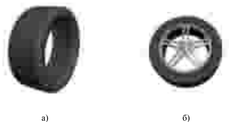
Рисунок 1 – Примеры двух способов создания объекта

При построении модели необходимо учитывать её дальнейшее спользование. Если это будет основной компонент сцены и он будет отображаться крупно, то необходима его детальная проработка. Если же это будет небольшая деталь, то её детальная проработка будет неуместна. Выполним сравнение подходов моделирования колеса автомобиля, примерное соотношение размеров выполняется на основе игры Need For Speed, адаптированной для iPhone. На рисунке 1 представлены 2 варианта покрышки автомобиля: а) – получен путём сеточного моделирования, б) – полученная с использованием примитива, который подвергся дополнительной обработке.