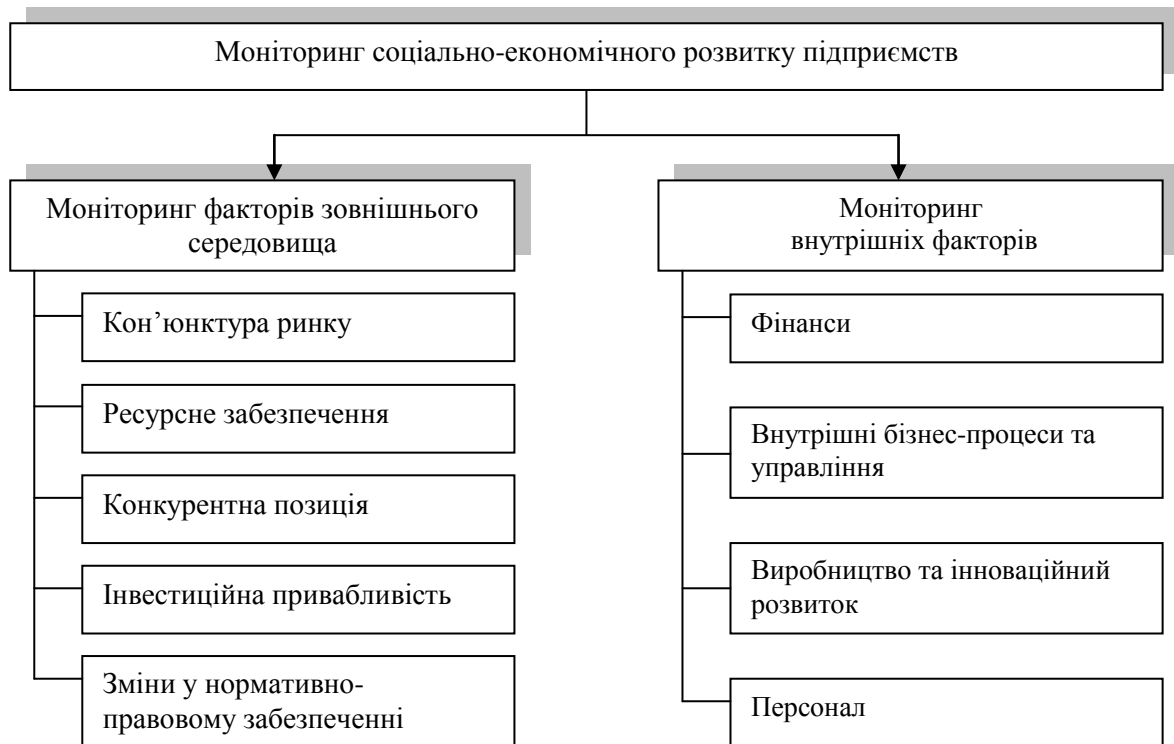
Рис. 1. Об'єкти моніторингу соціально-економічного розвитку підприємств

Впровадження системи моніторингу соціально-економічного розвитку підприємств складається з двох великих етапів: на першому етапі система моніторингу формується і впроваджується у життя; на другому – відбувається її корегування з урахуванням виявлених недоліків і тенденцій розвитку зовнішнього середовища.