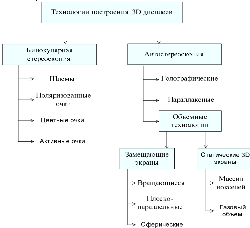
Рисунок 1 – Классификация 3D устройств отображения

очередь на отображение статических сцен.