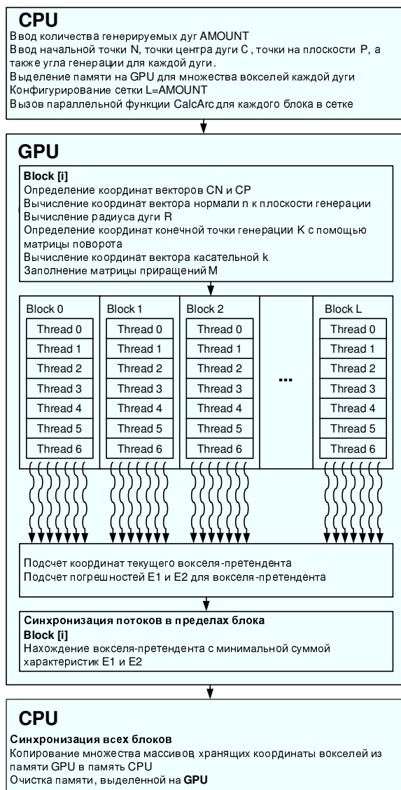
Рисунок 2 - Общая схема работы параллельного алгоритма генерации заданного количества дуг