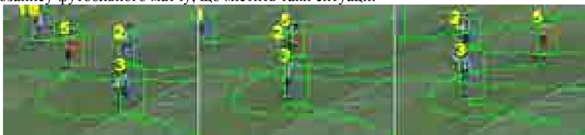
Рисунок 2 — Приклад відстежування об'єктів в умовах часткового перекриття

Експерименти показали, що розроблений алгоритм може відстежувати об'єкти в умовах часткового перекриття. На рис. 2 приведені фрагменти трьох проаналізованих кадрів з відеозапису футбольного матчу, що містить такі ситуації.