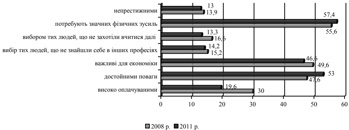
Рис. 3. Ставлення випускників шкіл до робітничих професій

З метою визначення ставлення молоді до робітничих професій та виявлення мотивів отримання робітничих професій до анкети були включені декілька запитань. Більшість випускників вважають робітничі професії: потребуючих значних фізичних зусиль (57,4% у 2011 р. проти 55,6% у 2008 р.), важливими для економіки країни (46,6% проти 49,6%), вибором тих людей, що не захотіли вчитися далі (13,3% проти 16,6%), неprestижними (13,9% проти 13,3%), вибором тих людей, що не знайшли себе в інших професіях (14,2% проти 15,2%), важливими для економіки (46,6% проти 49,6%), достойними поваги (53% проти 47,6%), високо оплачуваними (19,6% проти 30%). Дані, отримані в ході опитувань протягом 2008-2011 рр., свідчать про те, що суттєвих змін у ставленні випускників до робітничих професій не відбулося.