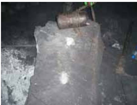
Рис. 2 – Общий вид негабаритного блока песчаника до разрушения

Так на ПК38 было проведено разрушение негабаритного блока имеющего форму близкую к параллелепипеду, представленного массивным монолитным песчаником. Средние размеры негабарита 90х60х35см. В блоке было пробурено два шпура, расположенных в ряд по длинной стороне негабарита, с расстоянием между шпурами 30см, и расстоянием до границ негабарита 30см (рис. 2). Шпуры были пробурены под углом 75 градусов к горизонтали, длина шпуров – 40см, при этом их недобуривали до нижнего основания негабарита на 10-15см. Через 7 часов после заливки раствора НРС от шпура начала прорастать трещина (рис. 3), развитие которой привело к разрушению блока (рис. 4). Состояние стенок шпура с НРС после разрушения блока приведено на рисунке 5, на фотографии видно, что длина зарядной камеры с НРС составляет 50% от толщины блока.