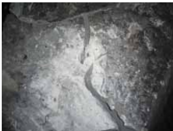
Рис. 4 – Общий вид негабаритного блока песчаника после разрушения