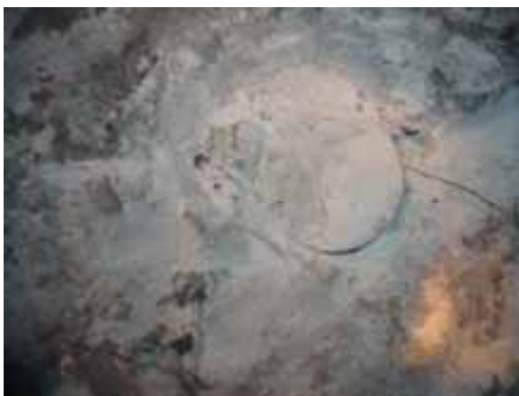
Рис. 3 – Начало разрушения – рост трещины