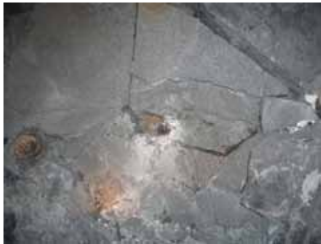
Рис. 7 – Общий вид разрушенной породы в забое подрывки при разделке габаритов рельсового пути.

На ПК38 было проведено разрушение пород почвы, представленных трещиноватым массивным песчаником. В забое подрывки было пробурено три шпура с расстоянием между ними 0,3м длиной 0,5м, и углом наклона к горизонтали 30 градусов, расстояние от устьев шпуров до свободной поверхности 0,4м. Через 2 часа после размещения НРС в шпуры произошел откол пород почвы, представляющих собой корж песчаника толщиной 0,25-0,3м, после чего происходило его смещение в сторону открытой плоскости забоя подрывки. Через 4 часа после начала эксперимента деформирование прекратилось. Отжатый блок породы был разрушен на три части. Ширина раскрытия трещин составляла 0,7-1,2см (рис. 8).