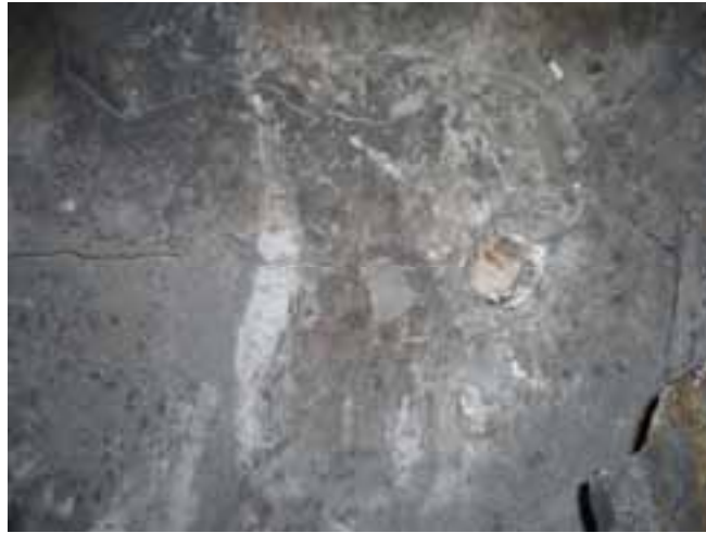
Рис. 6 – Магистральная трещина между шпурами с НРС

параллельно слоистости и отжат в сторону забоя подрывки (рис. 7), после чего возможна была уборка разрушенной породы вручную.