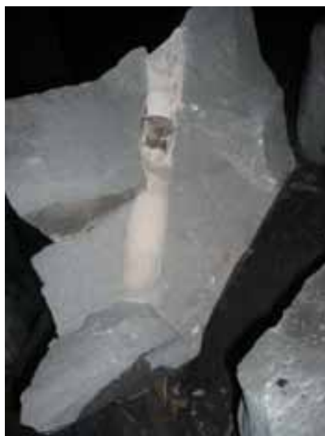
Рис. 5 – Общий вид стенок шпура с НРС после разрушения блока

Проведенные эксперименты доказали техническую возможность реализации разрушения горных пород при помощи НРС в условиях подземных горных выработок, а также подтвердили состоятельность предложенной методики определения параметров невзрывного разрушения.