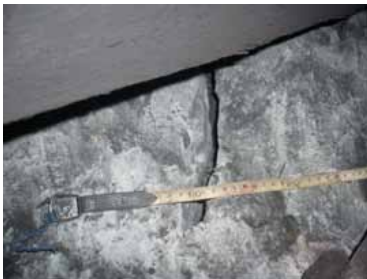
Рис. 8 – Общий вид разрушенной породы в забое подрывки.

Таким образом, проведенные исследования позволили сделать вывод о работоспособности предложенного способа невзрывного разрушения горных пород в случаях когда они представлены объектами с двумя и тремя свободными поверхностями в условиях подземных горных выработок. Разрушение пород при помощи невзрывчатых разрушающих составов обеспечивается при параметрах способа рассчитанных согласно методике предложенной авторами. При этом время разрушения монолитных блоков составляет 4-8 часов, и разрушение происходит в виде раскола пород по магистральной трещине соединяющей шпур. Разрушение трещиноватых мелкослоистых пород происходит за счет их отжима в направлении перпендикулярном напластованию, и поочередном разрушении отжатых слоев и пластинок. Поэтому способ подрывки прочных пород почвы, основанный на ее невзрывном разрушении может быть рекомендован для внедрения в выработках с породами почвы имеющими прочность на одноосное сжатие более 60 МПа.