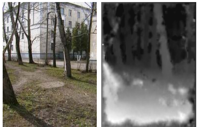
Рис 3. Легенда та же, что и на рис. 2