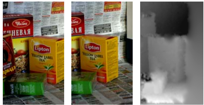
Рис 1. Слева – левое изображение, в центре – правое изображение, справа – карта смещений.

Время работы алгоритма на ноутбуке Athlon-XP-M-2200 для пары цветных снимков 480x640 составляет около 7 секунд и пропорционально числу пикселей на изображениях.