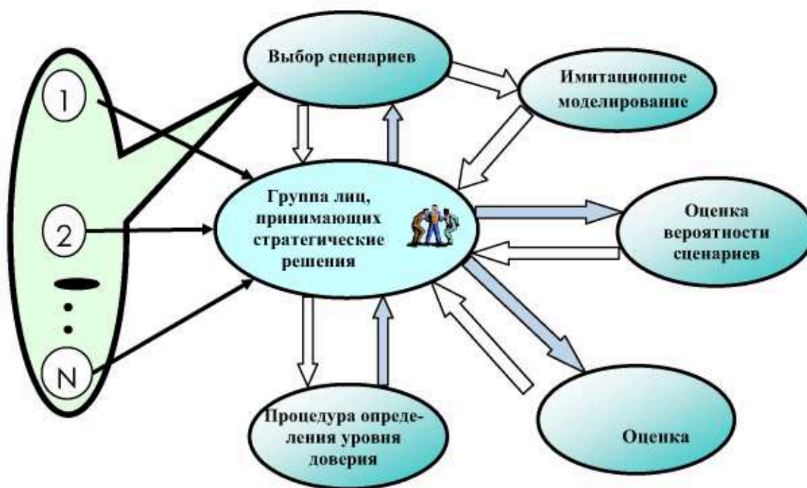
Рис. 3. 4-й этап предвидения — оценивание реалистичности сценариев, рисков, связанных с ними и доверия к ним

На четвертом этапе анализа и отбора сценарии предоставляются группе лиц, которые должны принимать стратегические решения и проводить всеобъемлющее исследование этих сценариев в соответствии со следующей процедурой: определение уровня реалистичности и реализуемости каждого сценария; оценка вероятностей событий, лежащих в основе сценариев; оценка рисков, связанных с каждым сценарием; имитационное моделирование; выбор наиболее приемлемых сценариев с точки зрения указанных выше критериев (рис. 3).