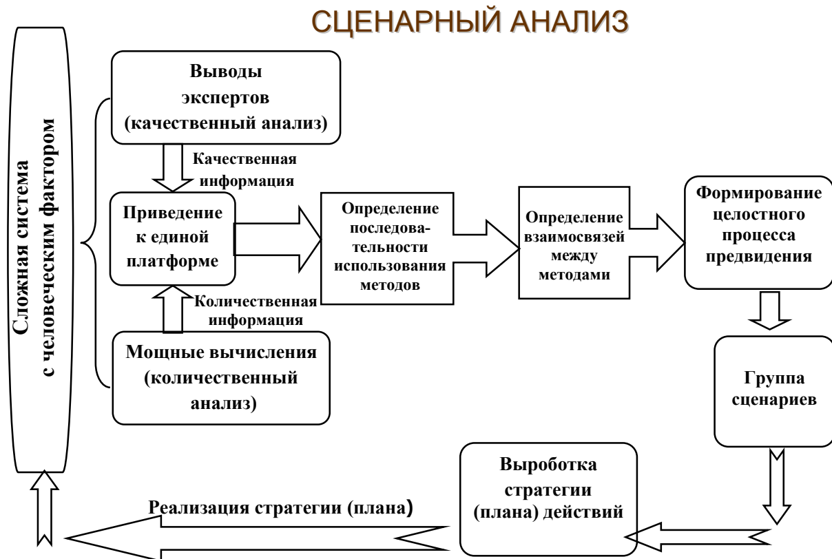
Рис. 2. Схема сценарного анализа формирования процесса предвидения

информация приводится к единой платформе. Определяется последовательность использования отдельных методов, и устанавливаются взаимосвязи между ними. Это позволяет далее сформировать целостный процесс предвидения и разработать группу сценариев будущего поведения объекта предвидения. Анализируя характеристики и особенности каждого из разработанных сценариев, группа лиц, принимающих стратегические решения, отбирает интересующие ее сценарии, вырабатывает план действий относительно объекта предвидения и обеспечивает реализацию этого плана.