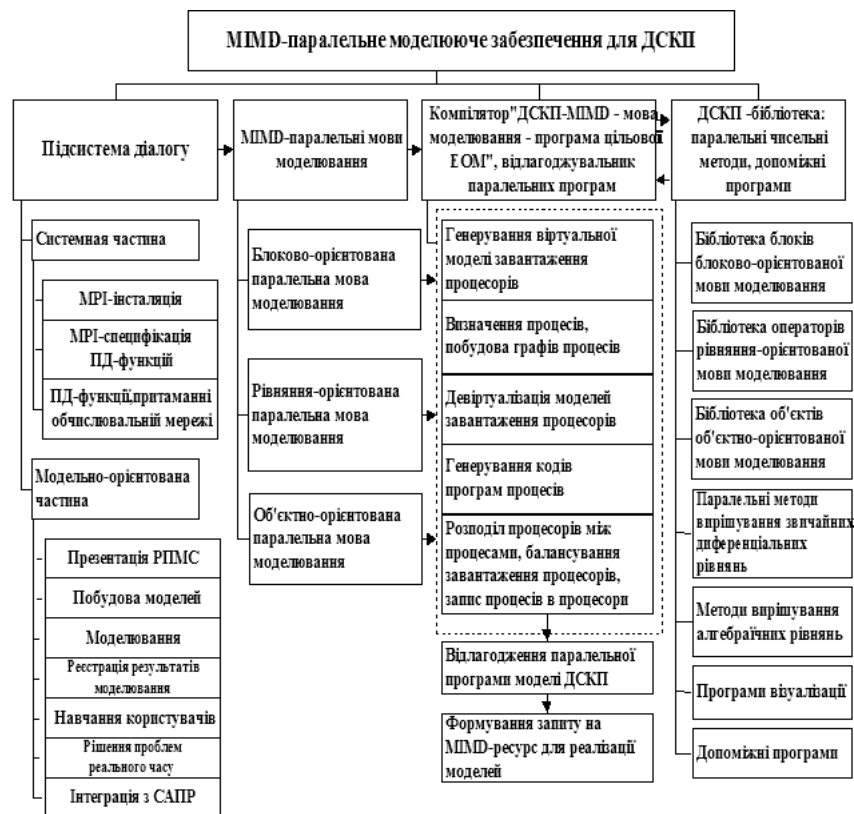
Рис. 3: Склад моделюючого програмного забезпечення МІМД-компоненти РПМС для ДСКП.

Відповідно до сформульованих вище концептуальних положень в МІМД-компоненті РПМС передбачені паралельні блоково-, рівняння-, та об'єктно-орієнтовані мови моделювання ДСКП (рис. 3). Незалежно від типу мови компілятор виконує перетворення специфікації моделі в функціонуючу паралельну програму та формує запит на МІМД-ресурс для реалізації моделі. Для моделювання ДСРП (рис.4) пропонуються рівняння- та об'єктно-орієнтовані мови специфікації моделей, на основі яких може бути виконана інтерактивна побудова ДСРП-моделей з використанням бібліотечних конструктивів. Досвід показує, що ДСКП-бібліотека повинна входити до складу ДСРП-бібліотеки.