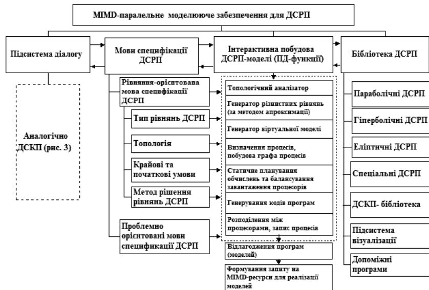
Рис. 4: Склад моделюючого програмного забезпечення MIMD-компоненти РПМС для ДСКП.