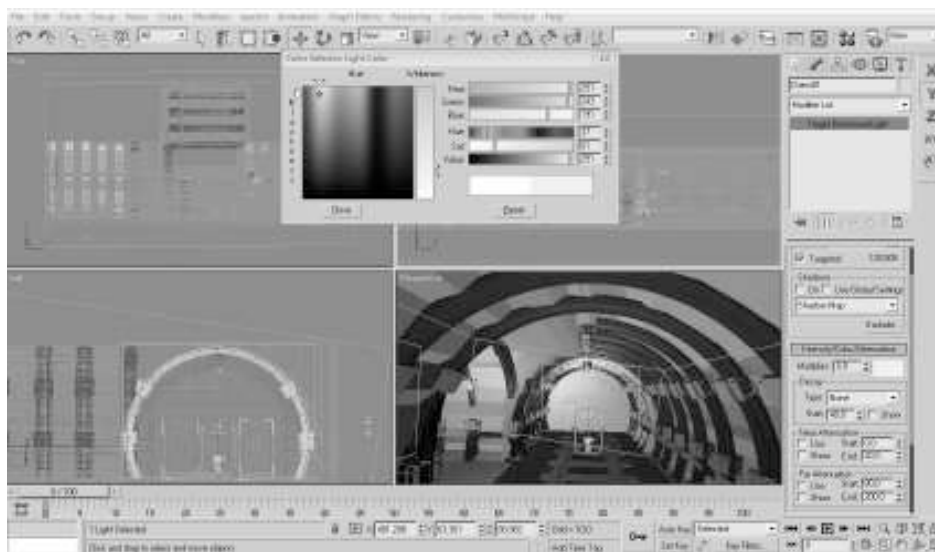
Рисунок 2 – Эффекты освещения

Цвет освещения изменен на желтый, как показано на рисунке 2.