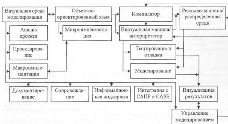
Рисунок 1. Структура объектно-ориентированной системы моделирования

Средства ОО-моделирования являются частью подсистемы диалога массивно параллельной моделирующей среды (МПМС) [7, 8, 9]. На основе структуры подсистемы диалога МЛМС [9] может быть предложена следующая структура ОО-системы моделирования (рис. 1).