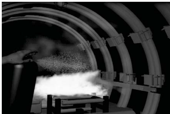
Рисунок 3. Работа приложения