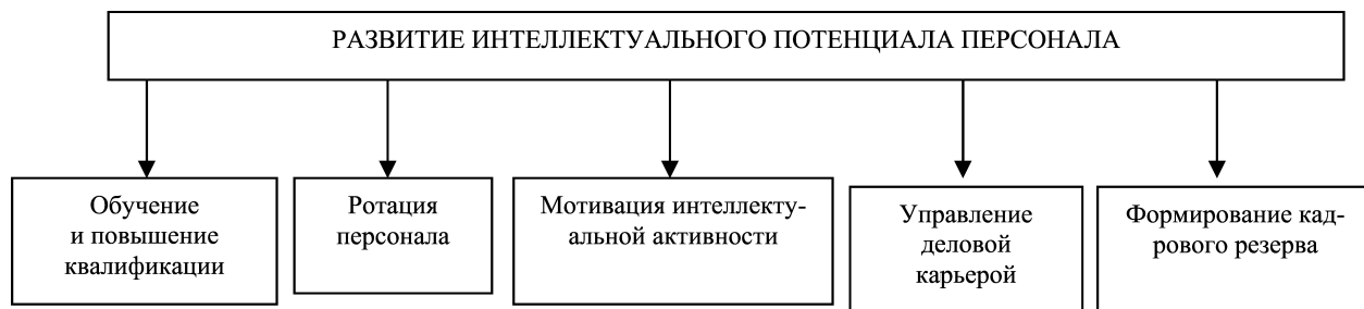
Рис. 1. Элементы развития интеллектуального потенциала персонала

Интеллектуальный потенциал персонала лежит в основе эффективной работы любой организации и является источником роста производительности труда. Развитие интеллектуального потенциала персонала представляет собой систему взаимосвязанных действий, основными элементами которой являются обучение, управление деловой карьерой, формирование кадрового резерва, ротация персонала и мотивация интеллектуальной активности (рис. 1).