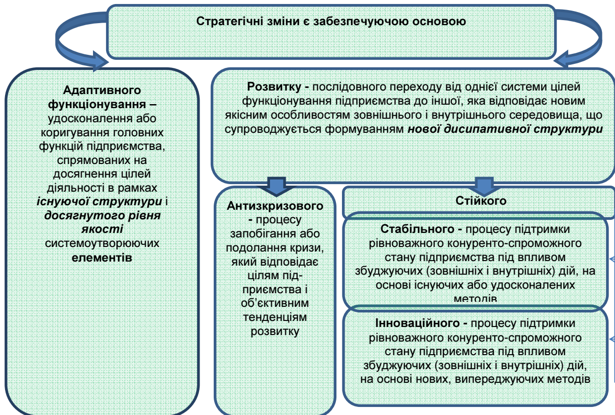
Рис. 2. Визначення напрямів функціонування та розвитку підприємства, забезпечуючою основою яких є стратегічні зміни