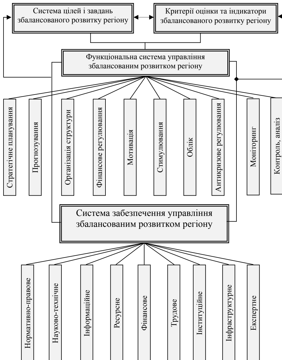
Рис. 2. Складові концепції збалансованого розвитку регіону

Функціональна система включає увесь масив складових елементів, який можна простежити у проміжку від постановки цілей до їх кінцевого досягнення, і містить такі структурні підсистеми управління, як планування, організація, мотивація, контроль, моніторинг, регулювання тощо. Система забезпечення містить супровідні елементи ресурсного, трудового, нормативно-правового, науково-технічного, інформаційного забезпечення.