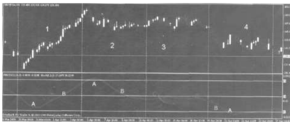
Рис. 2. Движение валютной пары GBP/JPY (4Н)

Анализ графика позволил выделить и описать на протяжении четырех недель (недели помечены цифрами 1, 2, 3, 4) 3 важные точки – А, В, С: