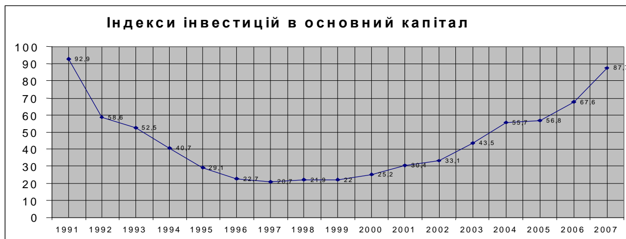
Рис. 2. Індекси інвестицій в основний капітал

де ЛП – розмір лізингових платежів, А – амортизаційна складова, С – відрахування в страхову компанію, ВЛ – відрахування лізинговій компанії.