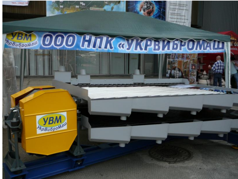
Рисунок 1. Промышленный образец концентрационного стола СКОБ-2,5х2 на Международной выставке «Уголь/Майнинг 2010»

Применение вибрационной техники с бигармоническим режимом колебаний при обогащении углей