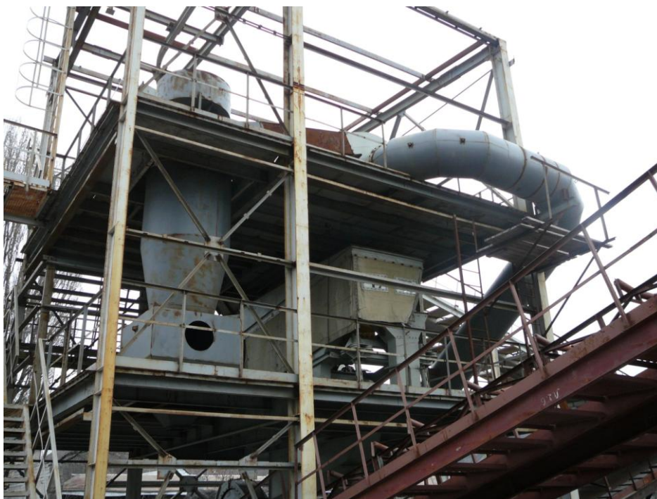
Рисунок 3. Монтаж модульной установки на базе сепаратора СВП-5,5х1