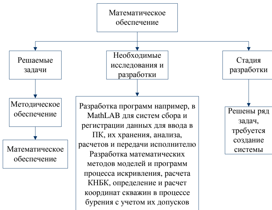
Рис. 2. Схема системы «направленное бурение» – Математическое обеспечение

Состояние и основные направления работ в дальнейшем в области направленного бурения приведены в на рисунках 2–7.