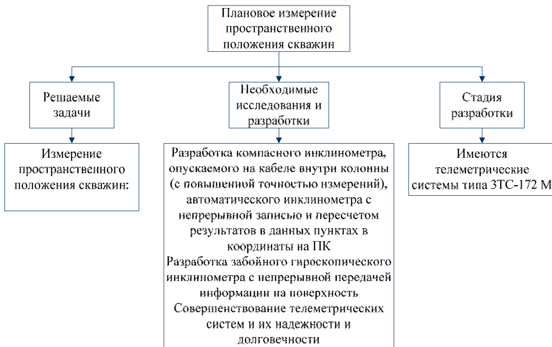
Рис. 7. Схема системы «направленное бурение» – Плановое измерение пространственного положения скважин

Существующая методика, техника и технология направленного бурения при условии выполнения работ в приведенной последовательности позволяет в настоящее время проводить скважины по проектной трассе в заданные пункты продуктивного пласта с высокой степенью вероятности.