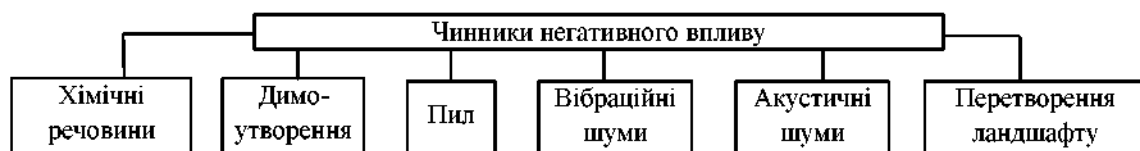
Рис. 1. Схема впливу автомобільних доріг на навколишнє середовище

Вплив автомобільних доріг і автотранспорту, що рухається ними, на навколишнє середовище виявляється у складній взаємодії чинників, які можна розділити на дві групи: дорожні та транспортні. До дорожніх чинників належать: відведення під будівництво автомобільної дороги земельних угідь; порушення єдності й цілісності природного комплексу; зміна природних комплексів і рельєфу місцевості протягом будівництва. До транспортних чинників належать: шум і загазованість повітря, що виникають внаслідок руху автомобільного транспорту; забруднення прилеглої до дороги смуги шкідливими речовинами, що містяться в відпрацьованих газах автомобілів. Автомобільна дорога порушує існуючі в природі основні баланси: біологічний; водний; гравітаційний; радіаційний [2]. Наведемо схему впливу автомобільних доріг на довкілля (рис. 1).