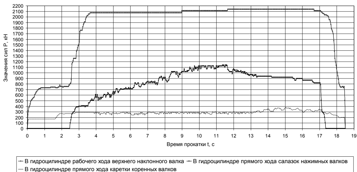
Рис. 2 – Графики сил при прокатке колес \varnothing 957 мм

Полученные значения сил (усредненные по 3-м параллельным замерам давлений) при прокатке черновых колес представлены в виде графических зависимостей от времени деформации и показаны на рис. 2.