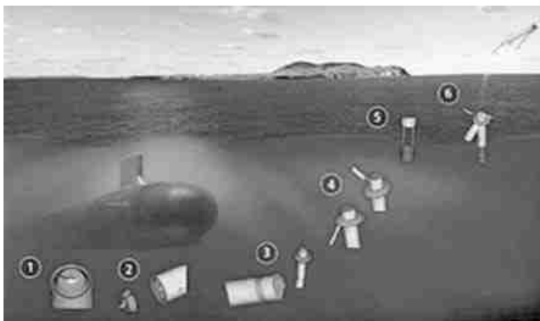
Рис. 1. Стадии запуска БПЛА с подводной лодки

При этом разработчики стремятся увеличить время автономной работы, дальность действия, грузоподъемность, чтобы не только оснастить аппарат всем необходимым, но и иметь возможность транспортировки полезного груза.