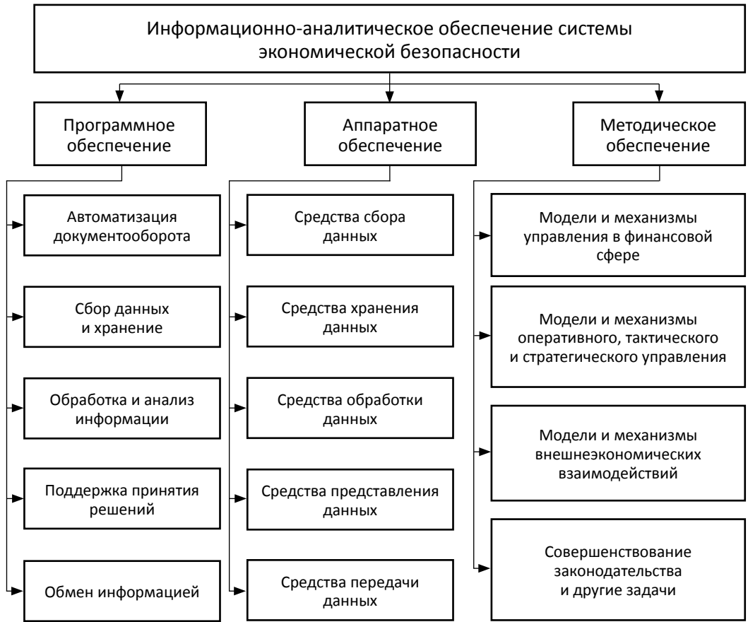
Рис. 2. Виды информационно-аналитического обеспечения системы экономической безопасности государства