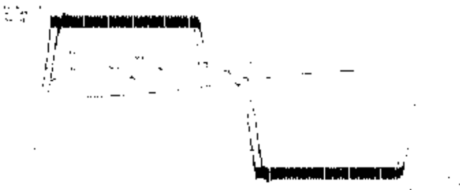
Рисунок 2. Результаты моделирования

Эффективность предложенных решений иллюстрируется результатами моделирования комбинированной СРП, которые представлены на рис.2 в виде графиков изменения тока якоря I_k , скорости W_k и положения S_k вала двигателя в сравнении с аналогичными графиками ( I_0, W_0, S_0 ) для СРП, работающей по отклонению (на схеме рис.1 \beta_1 = \beta_2 = \beta_3 = 0 ).