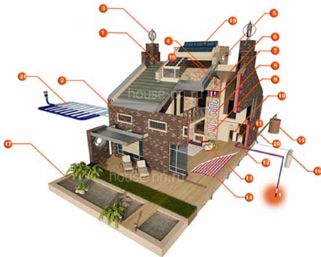
Рис. 2. Энергосберегающий дом:

В фазах 3 и 4 холодный наружный воздух, проходя через регенератор установки, нагревается почти до комнатной температуры и подается в помещение.