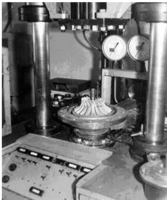
Рис. 2. Абразивно-экструзионная обработка крыльчатки на установке УЭШ-100

В лаборатории отделочных методов обработки Сибирского государственного аэрокосмического университета к настоящему времени накоплен большой объем экспериментальных и теоретических исследований АЭО деталей ЛА (рис. 2), а также технологической инструментальной оснастки, характеризующихся наличием сложнопрофильных поверхностей [11–15].