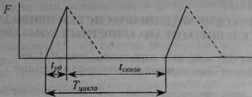
Рисунок 3 – Зависимость силы удара гидроимпульсной струи от времени

Таким образом, из полученных зависимостей следует: