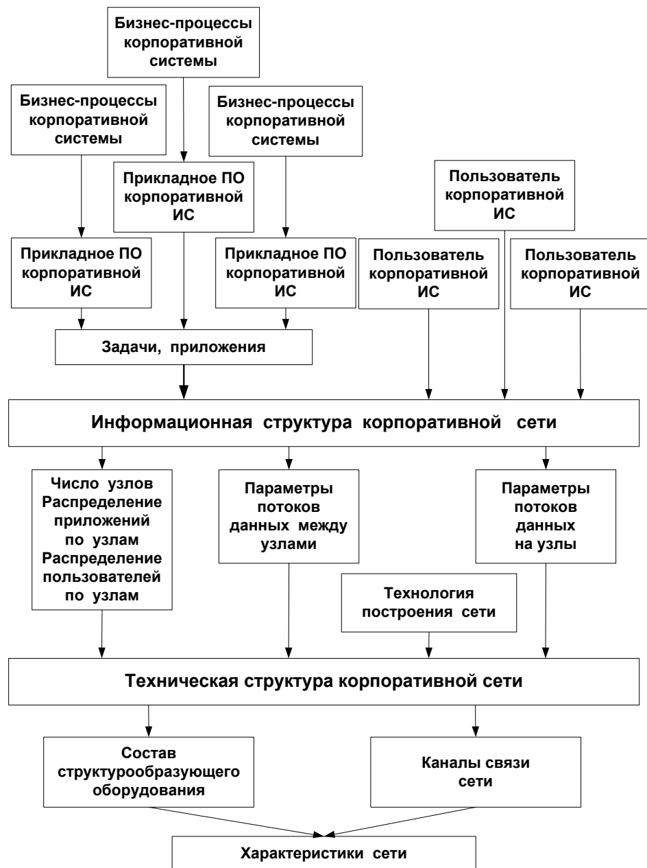
Рис. 1 Схема анализа структуры корпоративной сети

Схема проведения анализа структуры сети приведена на рис. 1.