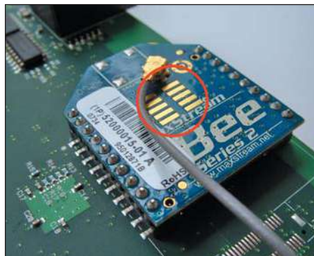
Рис. 2. Площадки для программатора

В теории — да. Для сетевого адреса отводится 2 байта, что обеспечивает адресную емкость для 65 535 устройств. Но спецификация ZigBee определяет ряд других параметров (косвенно связанных с максимальным числом устройств в сети) таким образом, что реально можно говорить не более чем о нескольких сотнях устройств в одной сети. При числе устройств более 300 существенно возрастает служебный трафик и, соответственно, падает пропускная способность. Главные ограничивающие факторы для большого количества узлов — это затраты