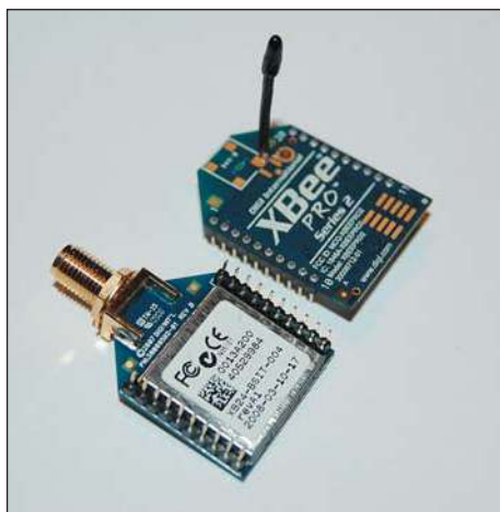
Рис. 1. Внешний вид радиомодулей XBee

В данной статье речь пойдет исключительно о модулях XBee Series 2 (рис. 1), то есть полноценных ZigBee-модулях, поддерживающих спецификацию ZigBee-2007 и позволяющих построить mesh-сеть, включающую спящие и мобильные устройства. Основным режимом работы модулей XBee — это работа под управлением внешнего микроконтроллера, управляющего модулем с помощью простых AT-команд или упорядоченных структур данных (режим API) [1].