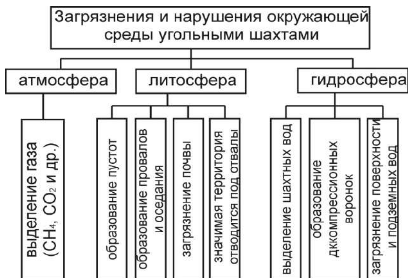
Рис. 1. Схема загрязнения и нарушения окружающей среды угольными шахтами

вод в поверхностные водные объекты – 37,3%, масса загрязняющих веществ, выбрасываемых в атмосферный воздух – на 39,36%, площадь нарушенных земель – на 50,1%, объем отходов производства – на 40,1%.