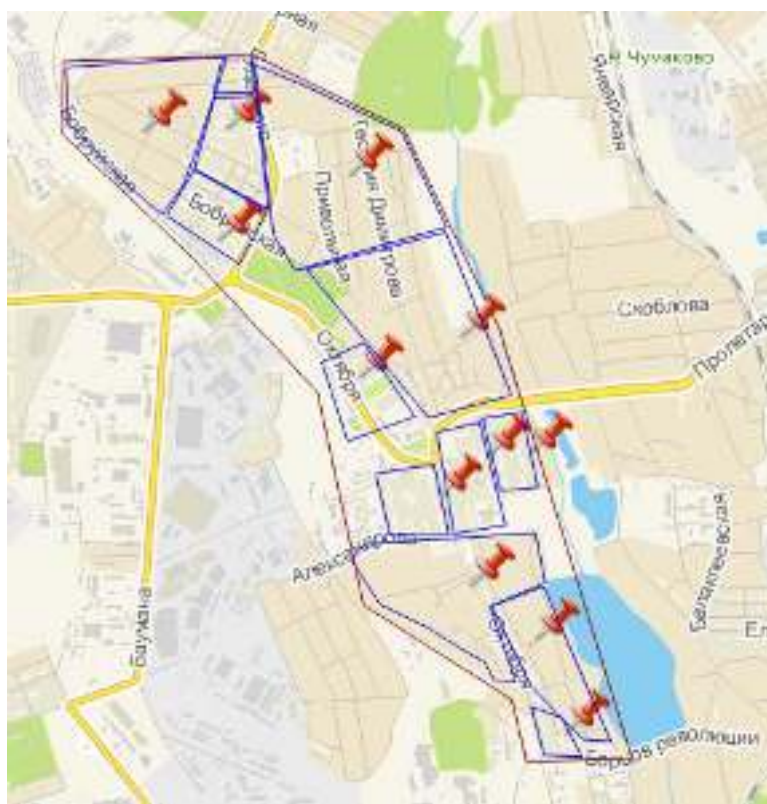
Рисунок 1- Разделение района на зоны обслуживания

Буденновский район находится на юго-востоке города Донецка и занимает территорию 25 км 2 с населением около 12350 человек. В настоящее время на рассматриваемом участке района (рис. 1) услуги доступа в Интернет предоставляют несколько провайдеров. Наиболее популярные из них: East.NET, MATRIX, ASDNet, Теленет. Однако, их телекоммуникационная инфраструктура создана достаточно давно, использует морально устаревшие технологии подключения абонентов, что не дает возможность предоставлять услуги с высоким качеством обслуживания. Также указанные провайдеры не всегда могут предоставить абонентам заявленную скорость передачи данных.