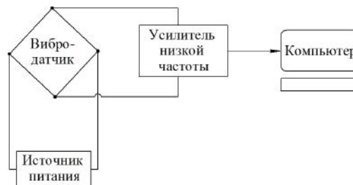
Рис. 1. Схема подключения вибродатчика к компьютеру

В процессе исследования разработан портативный преобразователь сигнала вибродатчика в звуковой формат, который приемлем для восприятия звуковой картой компьютера и имеет возможность одновременного подключения двух вибродатчиков. С помощью портативного компьютера через звуковой вход мы можем записать звуковую информацию и просмотреть её в графическом отображении. Также возможно подключение к щеточным тахометрам, тензомостам для определения динамики работы скоростей и ускорений как двигателей, так и машин в целом. Принципиальная схема подключения компьютера представлена на рис. 1.