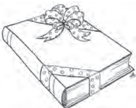
Книга лучший подарок