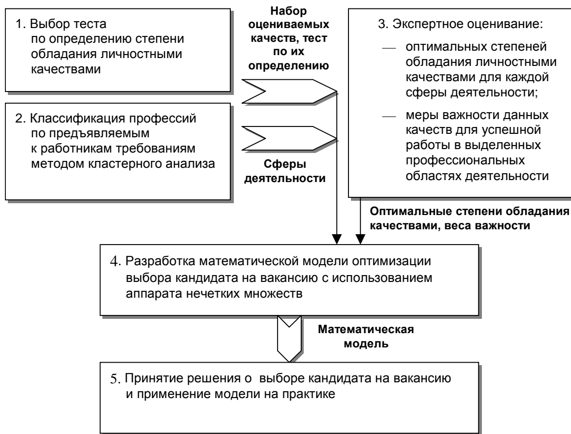
Рис. 2. Этапы построения математической модели принятия решения о выборе кандидата на вакансию

ляются различные профессии и соответствующие им личностные качества и умения персонала. Часть профессий не принималась во внимание, основываясь на том факте, что личностные качества не являются основными для работы в данных областях. Результатом классификации профессий явилось шесть укрупненных областей профессиональной деятельности: управление и социальная работа; интеллектуальная и научная деятельность; творческая деятельность («творцы за столом», т.е. не актеры и певцы и пр., а художники, дизайнеры, писатели...); сфера обслуживания; сфера продаж; учетные и канцелярские специальности.