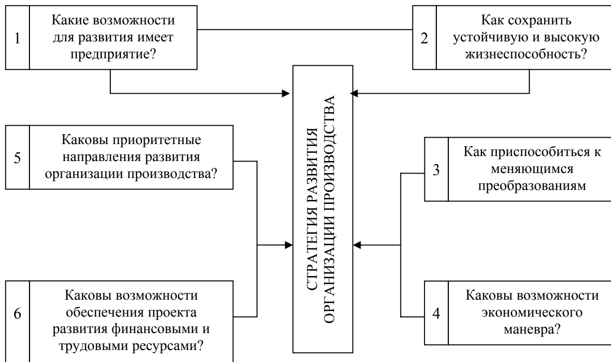
Рис. 2. Последовательность формирования стратегии развития организации производства

Оценив ключевые переменные и факторы выбора стратегии развития организации производства, можно перейти к составлению программы организационных преобразований (рис. 2).