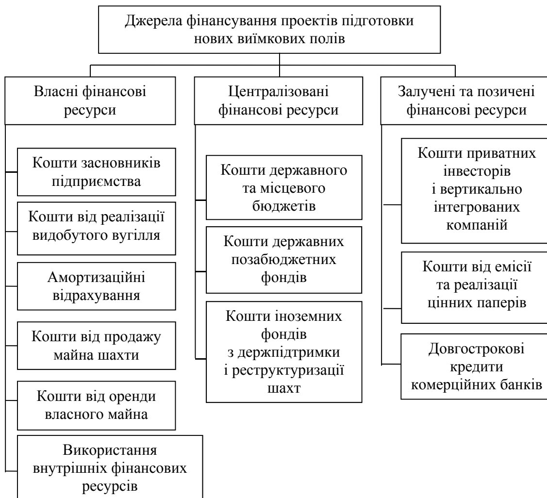
Рис. 1. Структура джерел фінансування капітальних вкладень у проекти підготовки нових виїмкових полів

Структура джерел фінансування інвестиційної програми розвитку на вугледобувних підприємствах залежить від багатьох факторів, зокрема: від рівня існуючого запасу корисної копалини, гірничо-геологічних умов, технічних умов, сучасності просторово-планувальних рішень, обсягу видобутку вугілля, структури активів підприємства, стану ринку капіталу, відсоткової політики комерційних банків, рівня управління фінансовими ресурсами підприємства; суті стратегічних цільових фінансових рішень підприємства тощо.