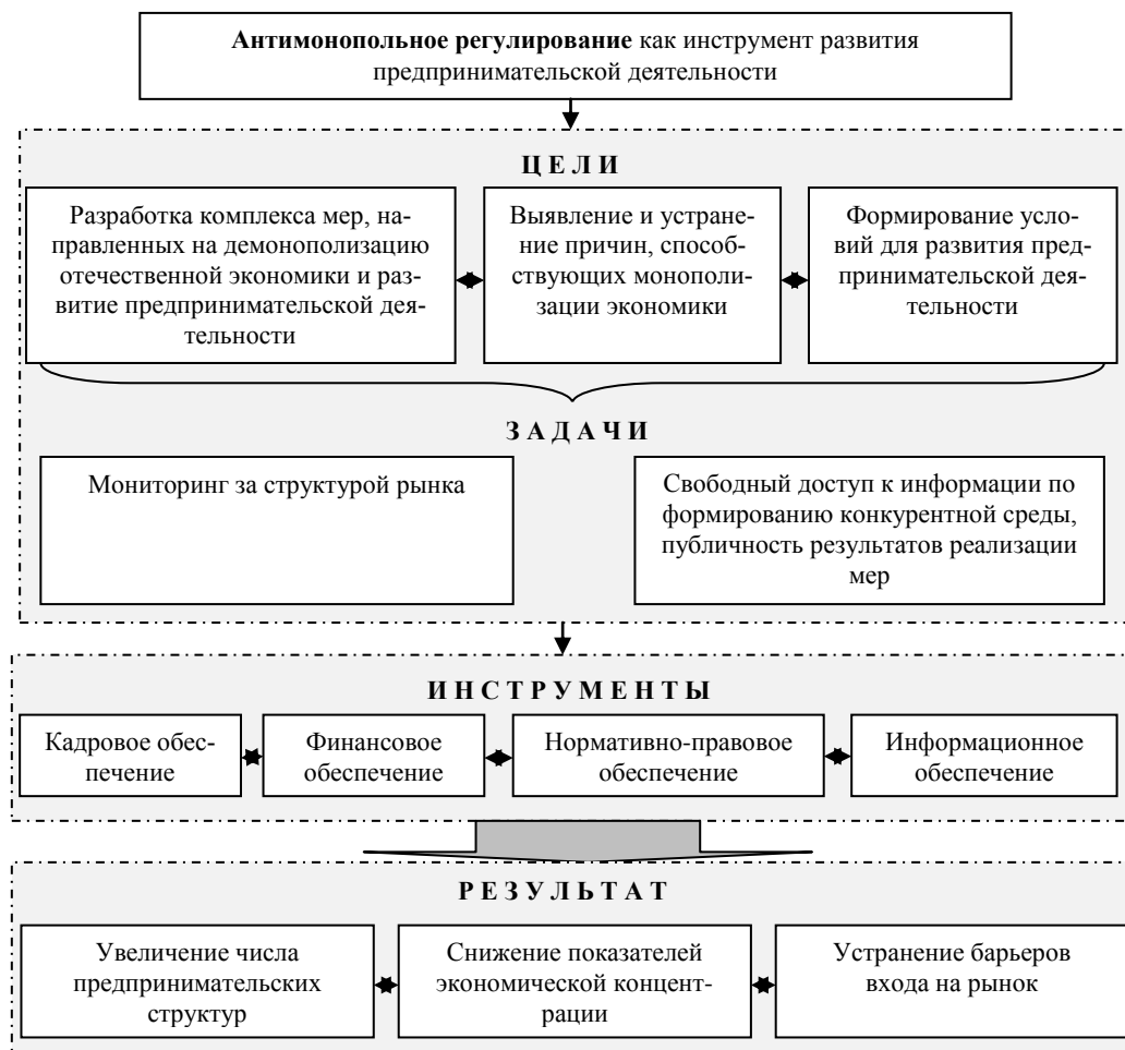
Рис. 2. Модель интегрированной системы управления поддержанием конкуренции

Кроме того, необходимо четко регламентировать вопросы, связанные с предоставлением и использованием государственной помощи, так как безграничное предоставление государственных средств, прав и привилегий оказывает непосредственное влияние на состояние конкуренции и ведет к нерациональному использованию ограниченных государственных ресурсов, сдерживанию структурных изменений в экономике за счет искусственного поддержания неконкурентоспособных производств, что отрицательным образом отражается на развитии предпринимательства в нашей стране.