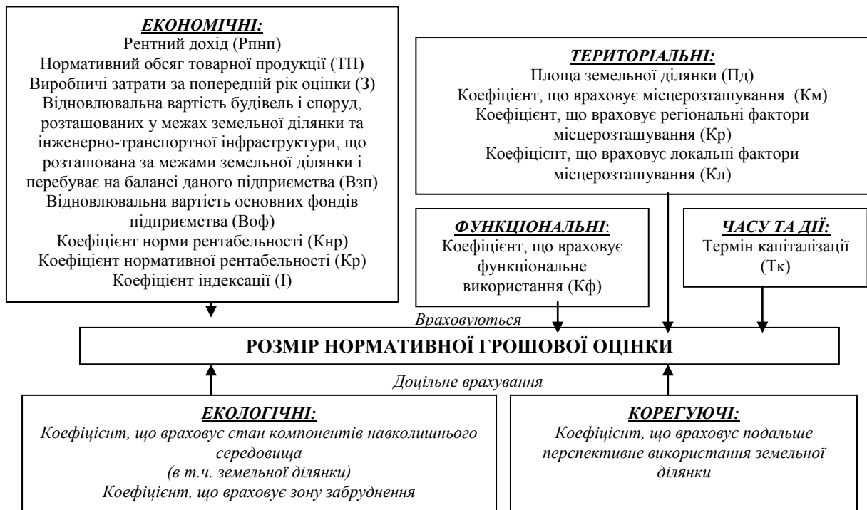
Рисунок 3 – Схема показників формування нормативної грошової оцінки [11]

Вартість земельної ділянки за методикою нормативної грошової оцінки ґрунтується на врахуванні наступних показників (рис. 3).