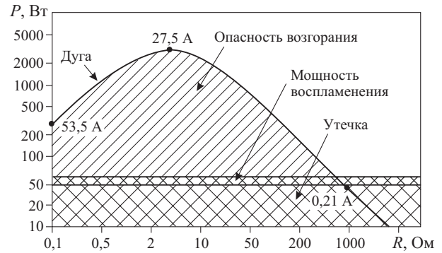
РИС.1. Зависимость мощности возгорания от сопротивления изоляции: P — мощность; R — сопротивление изоляции

В зависимости от сечения проводника, материала изоляции и наличия источника зажигания (электрический разряд при нарушении изоляции, протекание тока утечки у поверхности изоляции) ток утечки величиной 90 мА, что соответствует мощно-