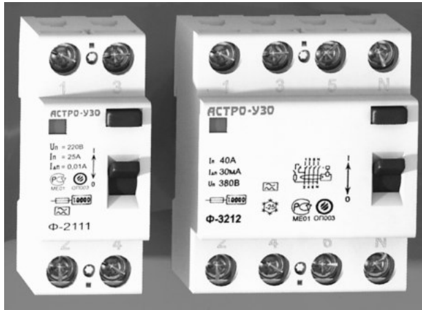
РИС.4. Общий вид УЗО

Примечание. I_n — номинальный ток нагрузки; I_{\Delta n} — номинальный отключающий дифференциальный ток.