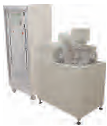
Рис.1. Установка Каролина Д-12А

Каролина Д-12А – вакуумная напылительная система, состоящая из вакуумного поста и стойки управления (рис.1). Предназначена для проведения исследовательских работ в области осаждения тонких пленок и для мелко- и среднесерийного производства. Она пригодна для магнетронного и (или) термического напыления пленок на керамические, кремниевые и другие подложки диаметром до 100 мм.