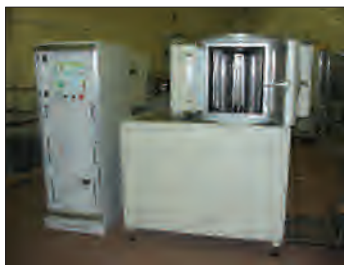
Рис.4. Установка Каролина D-12B

Откачной пост этой установки аналогичен посту Каролины D-12A, но компоновка вакуумной камеры – вертикальная (рис.4, 5). Такая компоновка и применение барабанного держателя подложек позволили значительно увеличить производительность установки. В результате за один цикл можно обрабатывать до 39 круглых подложек диаметром 100 мм или до 111 прямоугольных диэлектрических подложек размером 60x48 мм. Для удобства смены подложек на барабане в боковой стенке камеры предусмотрена загрузочная дверь. Кроме того, вертикальная компоновка установки позволила смонтировать протяженный ионный источник (рис.6) и увеличить максимальное число магнетронов в установке до восьми. Магнетроны размещаются внутри и снаружи цилиндрического барабана, благодаря чему удается напылять покрытие одновременно с двух сторон подложки. Магнетроны, расположенные снаружи барабана, смонтированы на открывающихся дверях, что значительно облегчает замену их мишеней. Размер мишени магнетронов 440x100x(6–15) мм (рис.7).