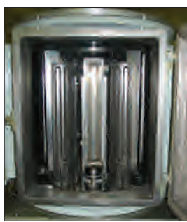
Рис.5. Рабочая камера установки Каролина D-12B

Эта установка создана на основе системы Каролина D-12B и предназначена для применения в особо чистых производствах. Для этого Каролина D-12B снабжена специальной плоской панелью, отделяющей чистую комнату от помещения, в котором размещается собственно установка. Вакуумная камера имеет прямоугольную дверь большого размера для удобства загрузки-выгрузки носителей. В чистую комнату открывается только загрузочная дверь. На панели крепится дублирующий дисплей системы управления работой установки. Таким образом, Каролина D-12B может управляться как из чистой комнаты, так и из менее чистого производственного помещения.