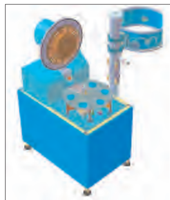
Рис.2. Рабочая камера установки Каролина Д-12А

Рабочая камера установки (рис.2) содержит полный набор устройств, необходимых для решения различных исследовательских и технологических задач. В зависимости от выбранной комплектации в набор входят от одного до четырех магнетронных источников, один-два термических испарителя, устройство плазменной очистки подложек, карусель для позиционирования подложек и нагреватель подложек. Рассмотрим эти узлы подробнее.