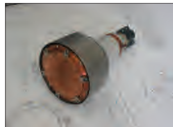
Рис.3. Магнетрон установки Каролина Д-12А

Кроме магнетронов под каруселью находится устройство плазменной очистки. С его помощью проводится предварительная очистка подложек бомбардировкой ионами кислорода