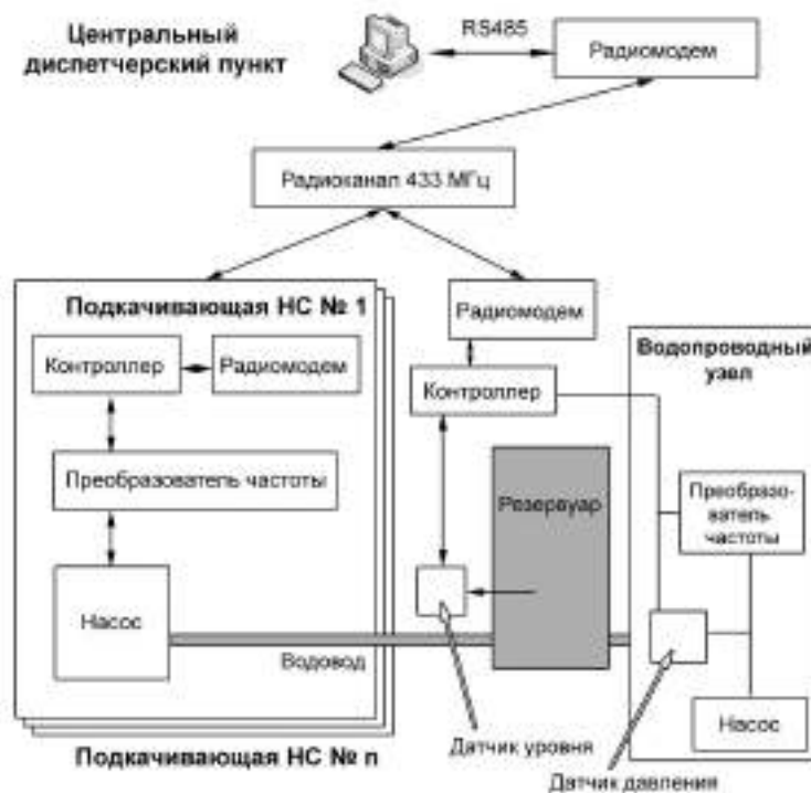
Рисунок 2 – Структура АСУ ТП типовой водозаборной станции

Технические средства, на основе которых комплектуется АСУ ТП – это средства мониторинга и измерений (расходомеры, погружные уровнемеры, датчики различных параметров и т.д.), средства управления (частотные преобразователи, приводы задвижек, системы регулирования и т.д.), коммуникационные устройства в случае использования устройств с различными протоколами, пульт диспетчера на основе широкоформатных экранов, микропроцессорные средства и ПЭВМ, радиомодемы и GSM-модемы, OPC-сервера и т.д. Программные средства АСУ ТП включают системы диспетчерского управления и сбора данных SCADA, АРМы диспетчера, базы данных и средства динамической визуализации данных, различное специальное ПО