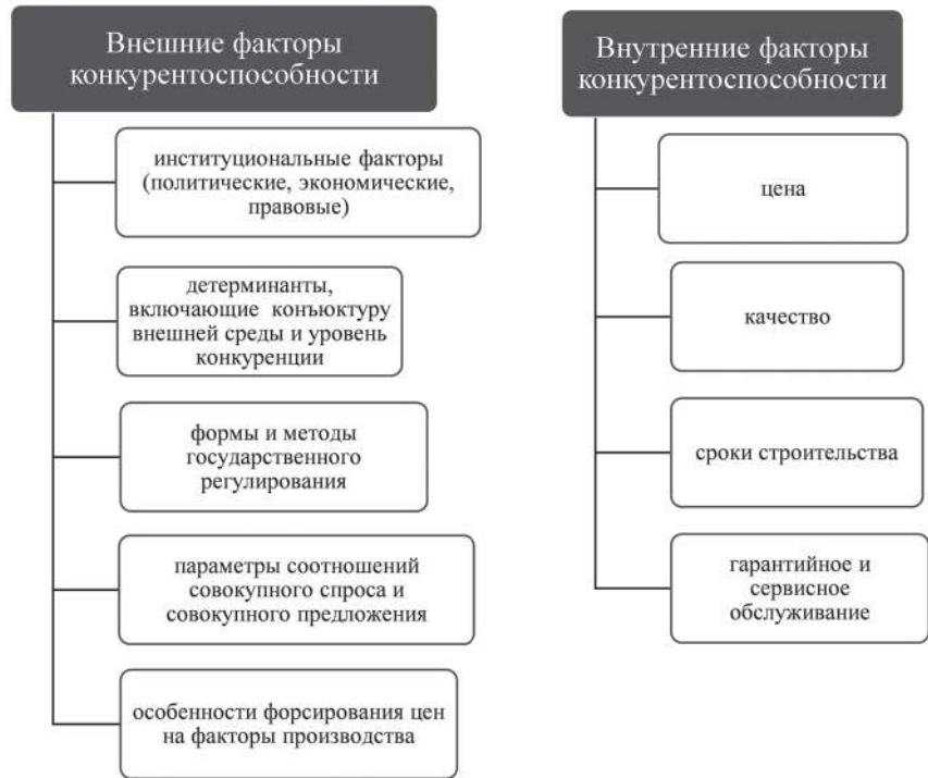
Рис. 1. Классификация В.В. Горбацевича

Способность самого экономического субъекта хозяйствования конкурировать, выигрывать в конкурентной борьбе, а так же проявление конкурентного отличия,