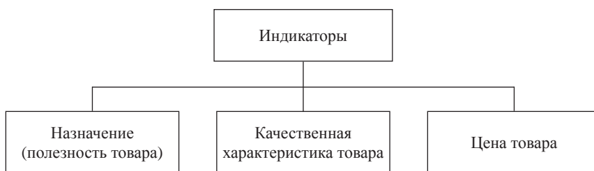
Рис. 3. Индикаторы конкурентоспособности