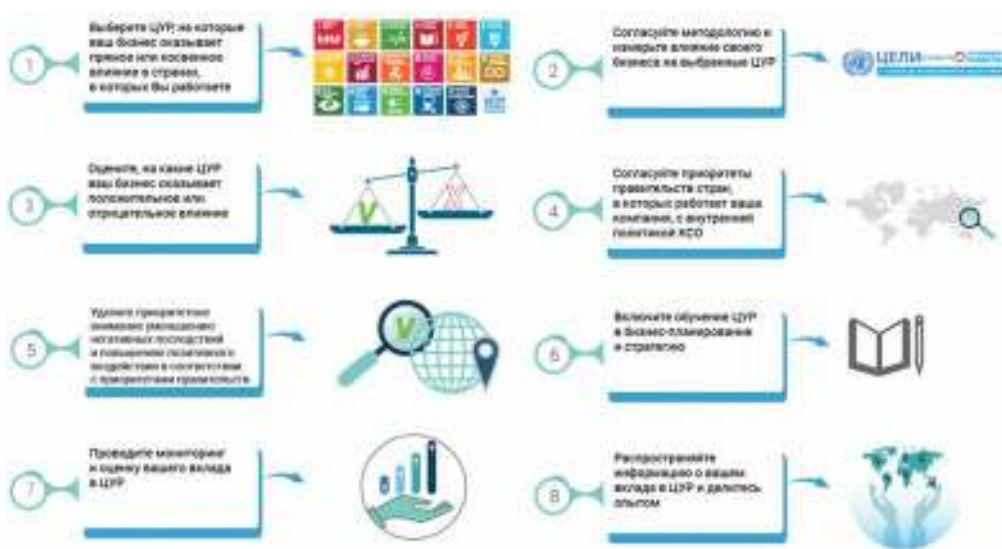
Рисунок 2. Матрица оценки для самоанализа предприятия на предмет адаптации к ЦУР

Предприятиям, которые согласовывают свою стратегию с национальными приори-