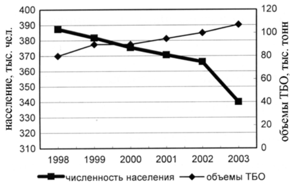
Рис. 4. Динамика изменения численности населения г. Мурманска и объемов утилизации ТБО на ОАО "Завод ТО ТБО"

Анализ проблем обращения с ТБО в Мурманской области и отечественного и зарубежного опыта позволил определить следующие рациональные направления удаления и переработки ТБО: предотвращение поступления