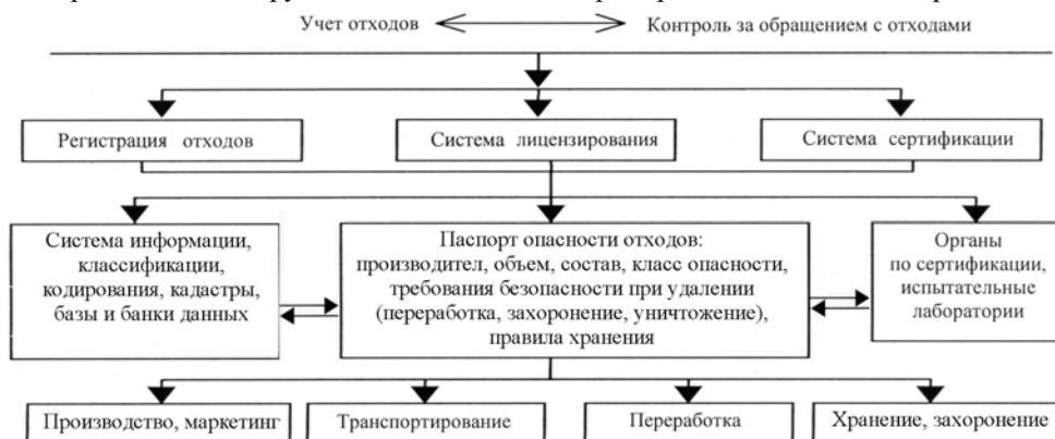
Рис. 3. Схема регионального регулирования обращения с отходами на основе их паспортизации и сертификации

Для ознакомления с воздействием типичных объектов размещения отходов был выбран полигон ТБО г. Мурманска, находящийся в пос. Дровяное. О воздействии полигона на поверхностные воды можно заключить по результатам многолетних наблюдений Мурманского УГМС за загрязнением снежного покрова и воды в ручьях, в бассейнах которых размещен полигон городских ТБО. Анализ