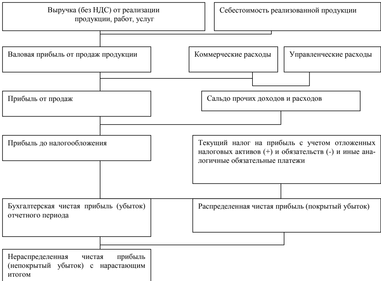
Рисунок 2 – Порядок формирования прибыли

Так как прибыль – важнейший показатель, характеризующий финансовый результат деятельности предприятия, то в увеличении прибыли заинтересованы все участники производства. Чтобы управлять прибылью, необходимо раскрыть механизм ее формирования, определить влияние и долю каждого фактора ее роста или снижения.