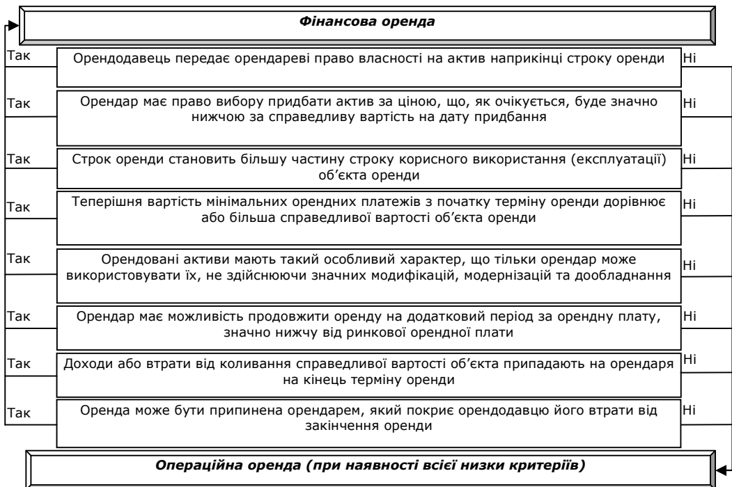
Рис. 1. Алгоритм поділу оренди для цілей бухгалтерського обліку на основі національного стандарту

фінансовою, операційна ж є «орендою іншою, ніж фінансова», тобто визначається способом від супротивного. Одночасно, в МСБО 17 «Оренда» наведено приклади щодо класифікації операцій оренди як фінансової чи операційної. Якщо чітко дотримуватись логіки МСБО, оренду слід кваліфікувати як операційну за умови, коли в основному всі ризики і вигоди, пов'язані з правом власності, не передаються орендарю. Інформація, зазначена в міжнародному стандарті «Оренда» щодо класифікації, демонструє суб'єктивний підхід та наводить на думку, що віднесення оренди до фінансової чи операційної залежить скоріше від суті операції, а не форми контракту. В цьому випадку доцільно звернути увагу на принцип превалювання сутності над формою, згідно з яким операції обліковуються відповідно до їх сутності, а не лише виходячи з юридичної форми [5]. Що стосується об'єкта, взятого в фінансову оренду, він буде відображатись на балансі того суб'єкта підприємницької діяльності, який отримує економічну вигоду від його використання, а не формально володіє ним.