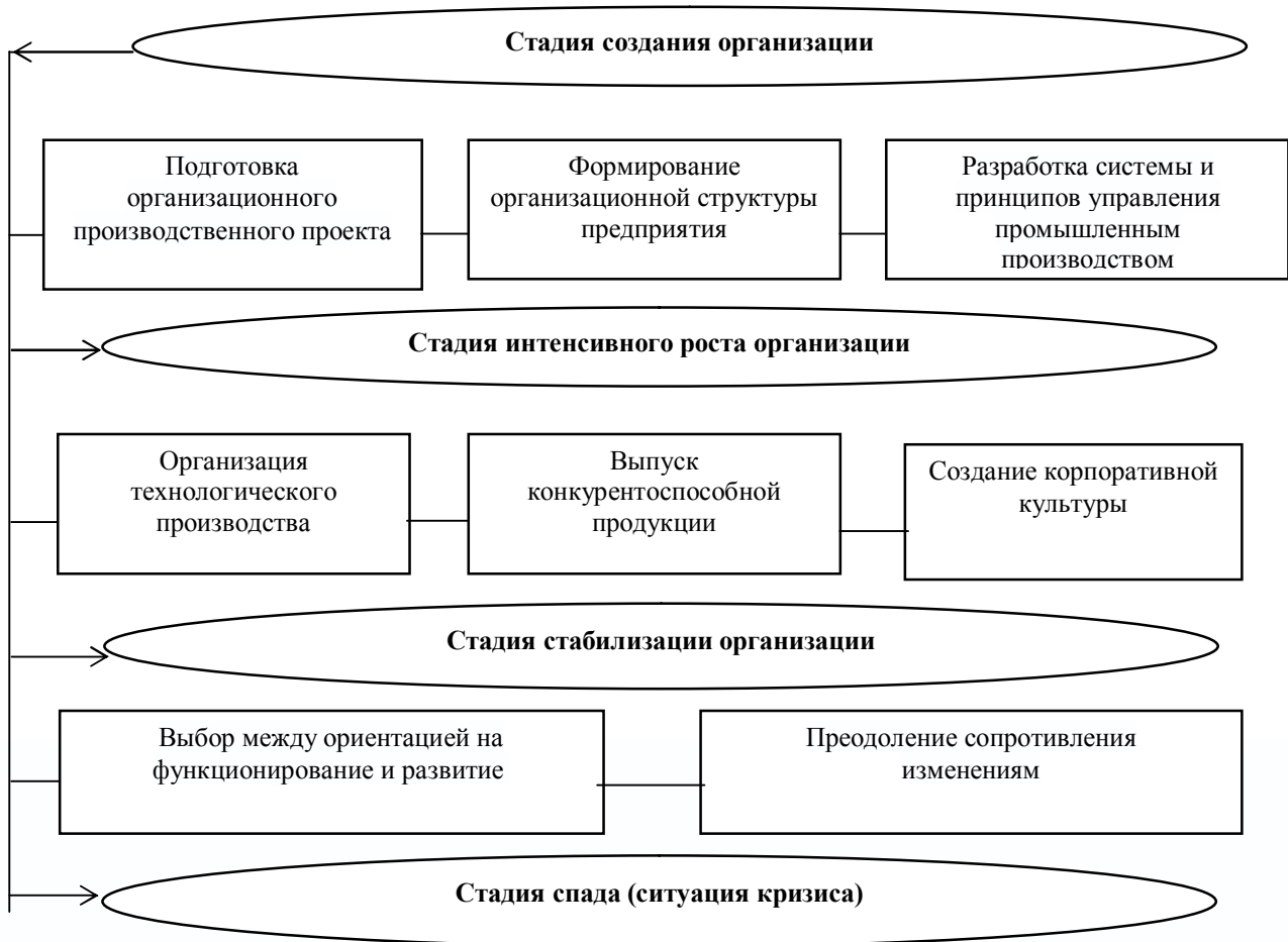
Рисунок 3 – Формирование системы управления устойчивым развитием в зависимости от стадий функционирования предприятия

На этапе создания промышленного предприятия в рамках бизнес-плана необходимо описать организацию производственного проекта, создание организационной структуры, рассчитать затраты, в том числе на приобретение материальных ресурсов, набор и обучение персонала, оплату труда. Для выбора места дислокации предприятия необходимо провести анализ рынка сбыта, географическое расположение, источники финансирования.