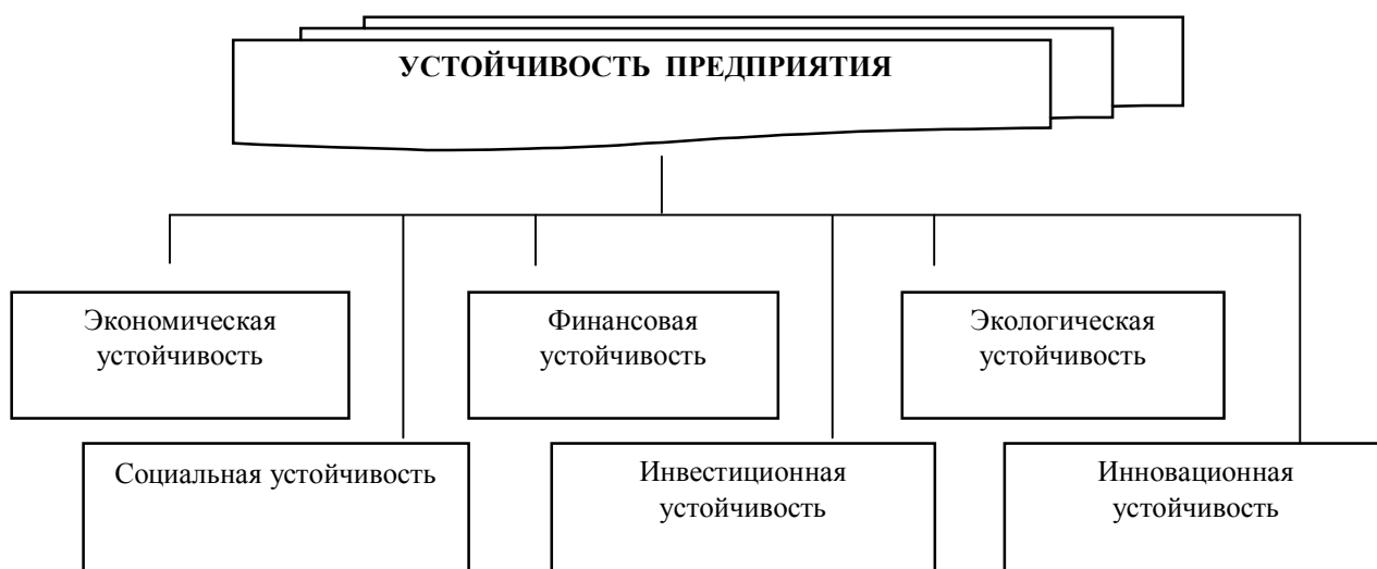
Рисунок 2 – Виды устойчивости промышленного предприятия

Процесс управления устойчивым развитием промышленного предприятия охватывает все основные виды устойчивости, в том числе экономическую, социальную, финансовую, экологическую, инвестиционную, инновационную (рис. 2).